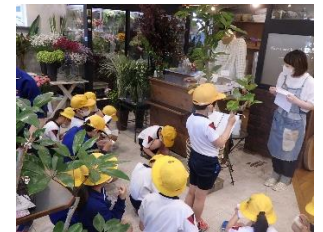
フラワーショップSACHI 10iro